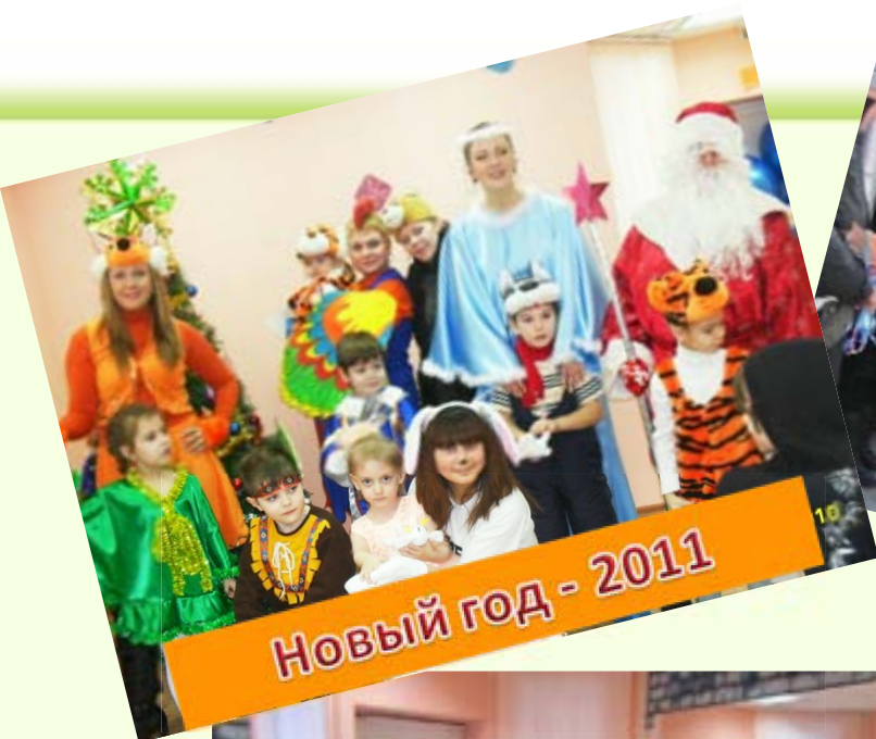
Новый год - 2011